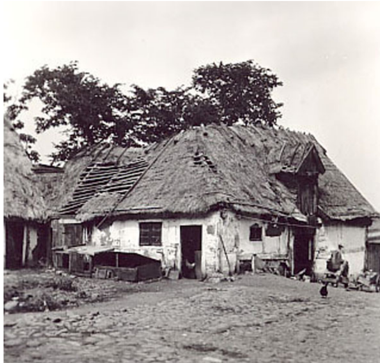
Gården Lilla Svedala nr 11 med resterna av kvarnen blev utförligt dokumenterad 1939 av Gunnar Hobroh och Ingemar Ingers från Folkminnesarkivet i Lund