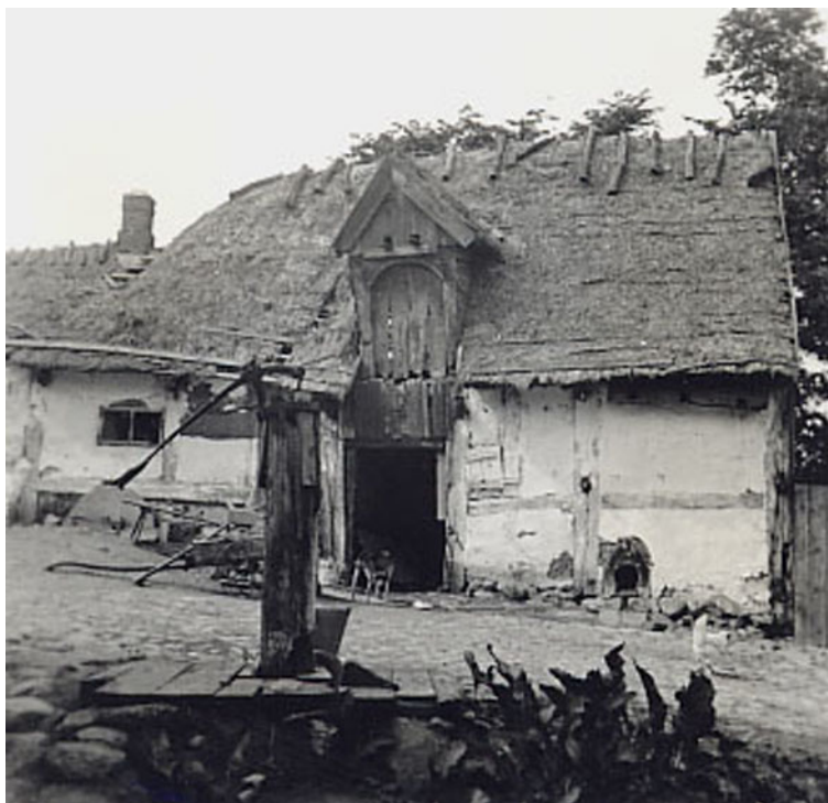
Lilla Svedala vattenmølla, foto från 1939 års dokumentation, Lunds Universitets Folklivsarkiv.