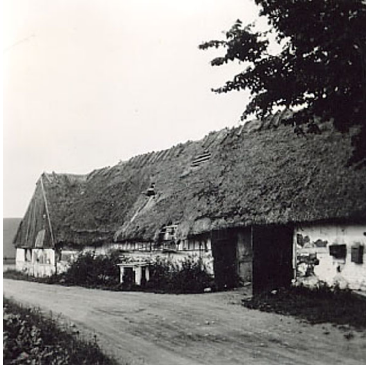
Lilla Svedala vattenmølla, ekonomibyggnaderna, foto från 1939 års dokumentation, Lunds Universitets Folklivsarkiv.